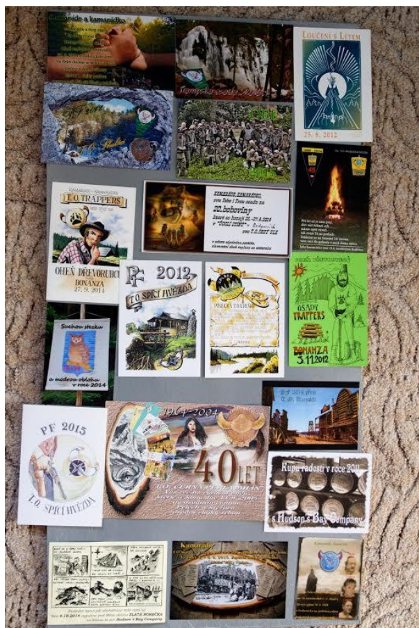
„Zvadla“ Martinova vlastnictví, archiv autorky.