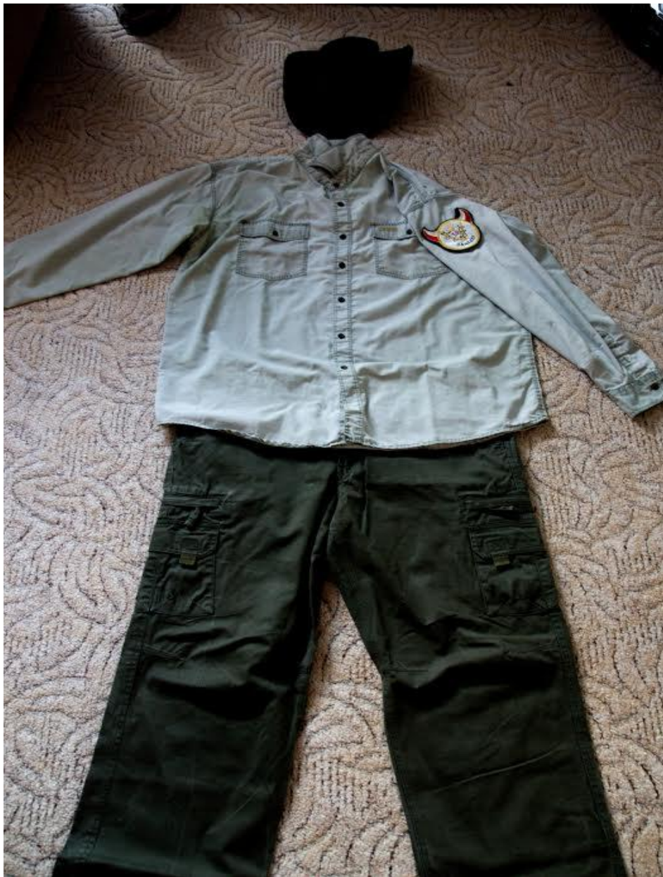
Typické tramské oblečení s domovenkou „T. O. Skaláci“ na rameni.