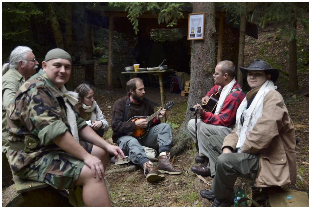
Část osadníků během pobytu v osadě.