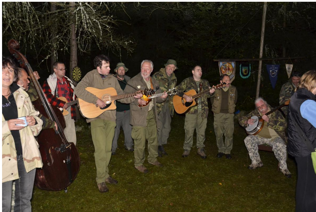
Hudební produkce během potlachu, archiv Martina Gregora.