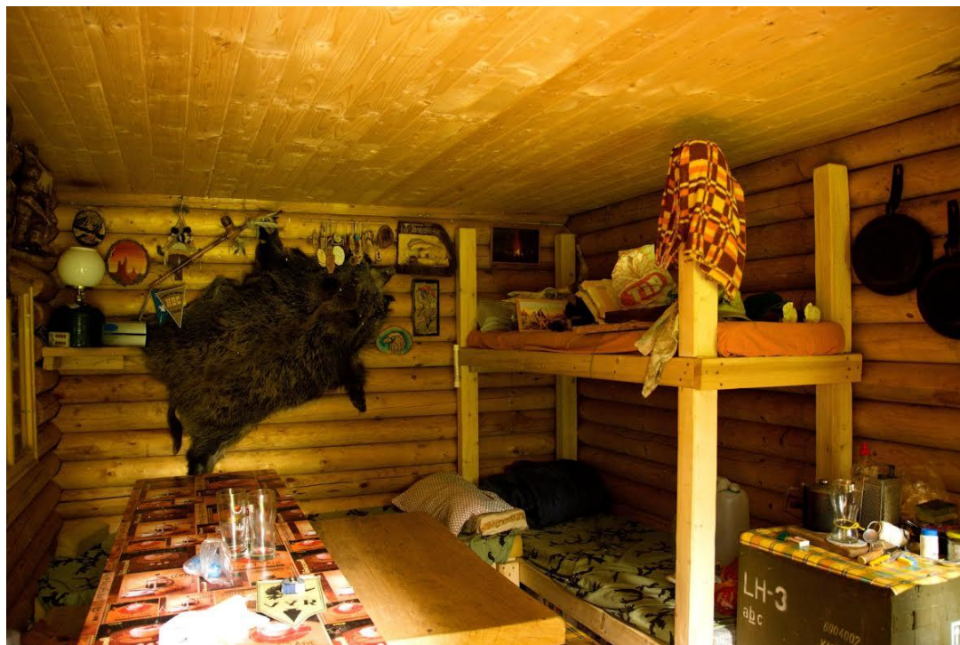
Pohled na interiér srubu v osadě „Skaláci“.