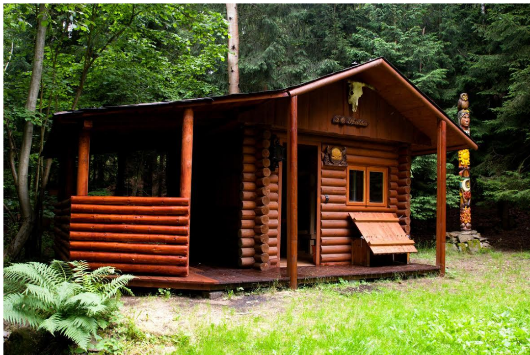
Pohled na exteriér srubu v osadě „Skaláci“, archiv autorky.