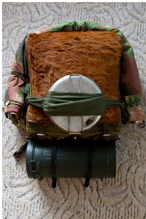
Jakubovo vojenská torňa z první světové války, tzv. „tele“, typická výbava na vandr, archiv autorky.