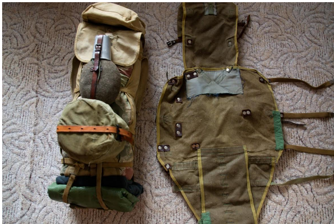
Martinova vojenská torňa, tzv. „usárna“, typická výbava na vandr