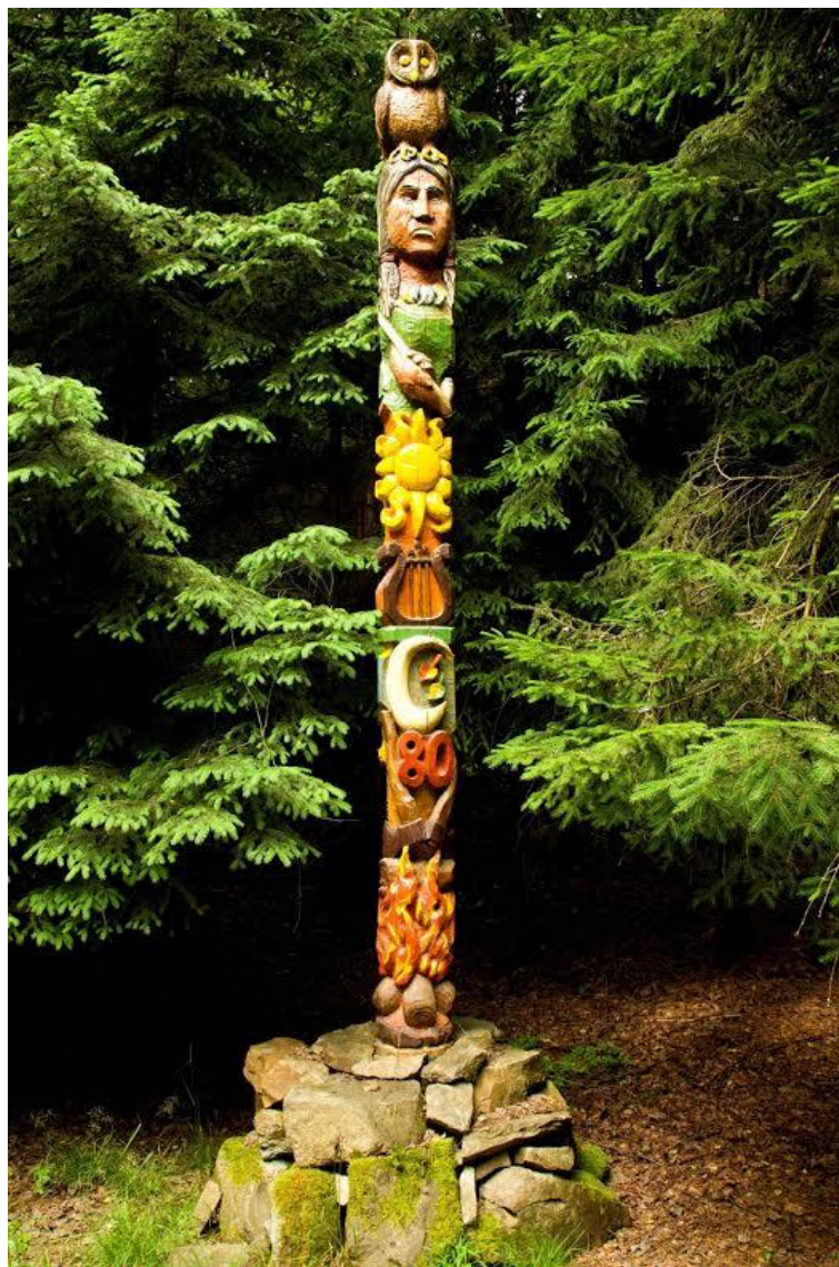
Nový osadní totem (v osadě od roku 2009)