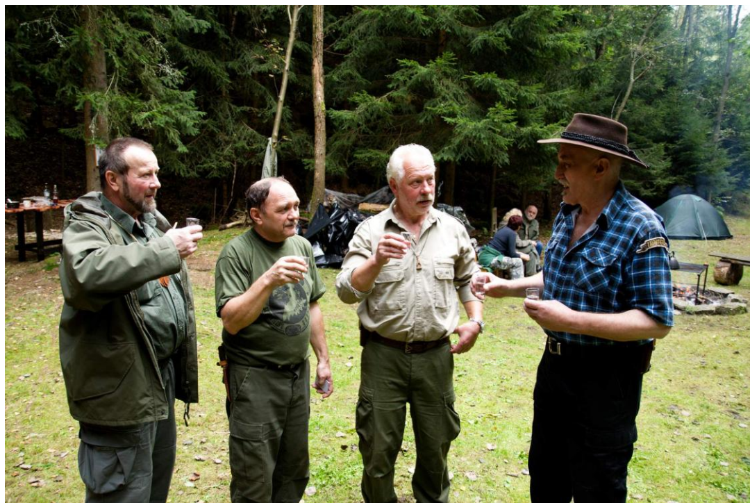
Začíná se popíjet, výroční oheň.