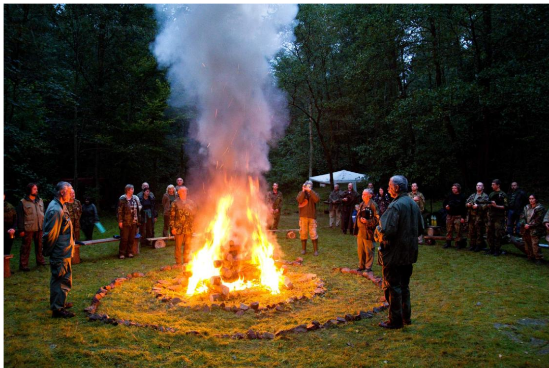
Výroční oheň, těsně po zapálení slavnostního ohně.