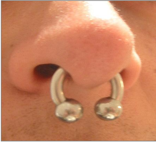
septum piercing