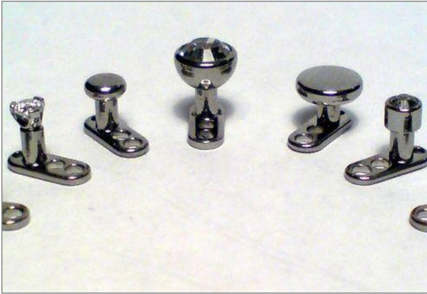
transdermální implantáty