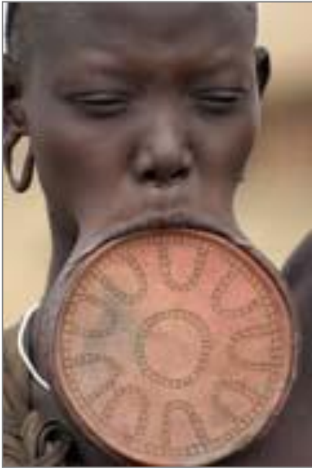
dívka z kmene Mursi z povodí řeky Omo, typický stretching dolního rtu a ušních boltců