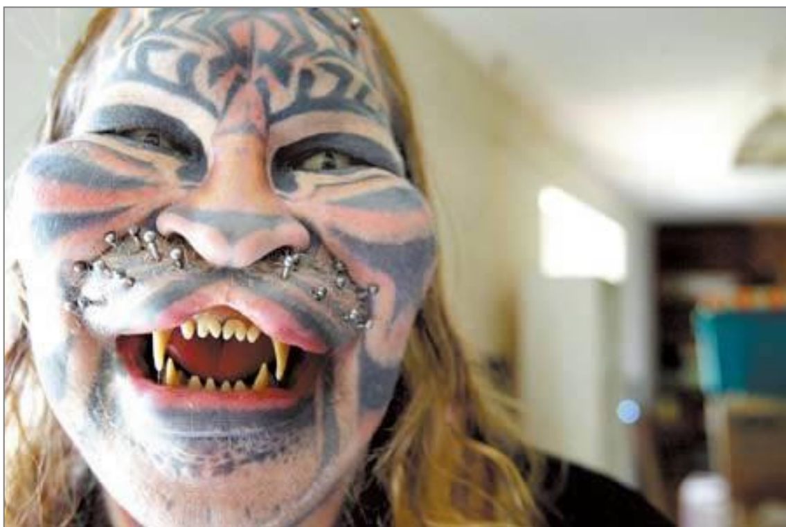
výrazná zvířecí stylizace: subdermální a transdermální implantáty, tetování v obličeji, tooth filling, piercing nad horním rtem, www.google.cz/images