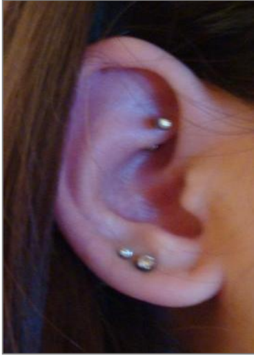
rook piercing, www.google.cz/images