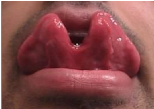
splitting jazyka, www.google.cz/images