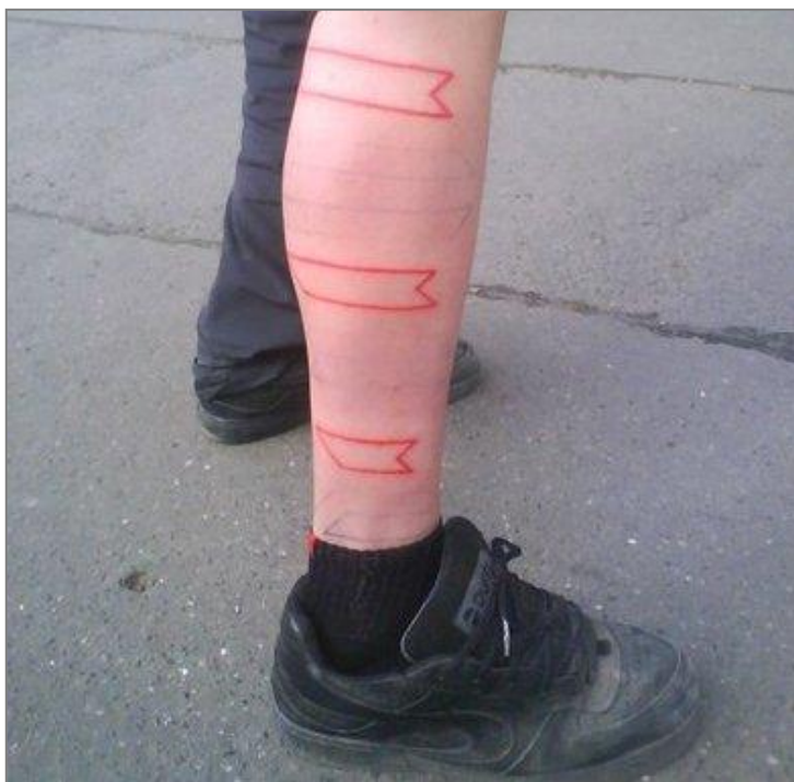
tetování na noze (tattér: Nikola)