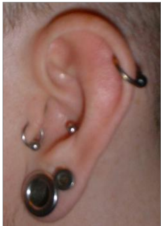
stretching ušního boltce