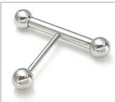
t-bar piercing