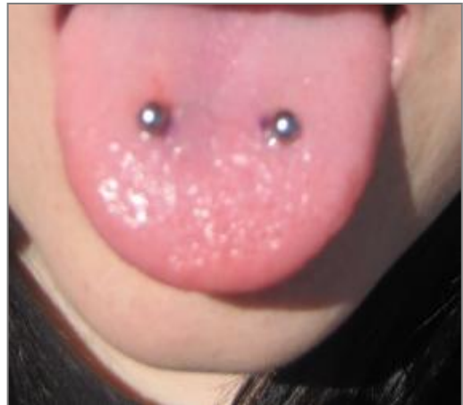
scoop piercing