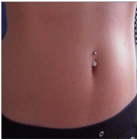
piercing pupíku (tzv. Britney piercing)