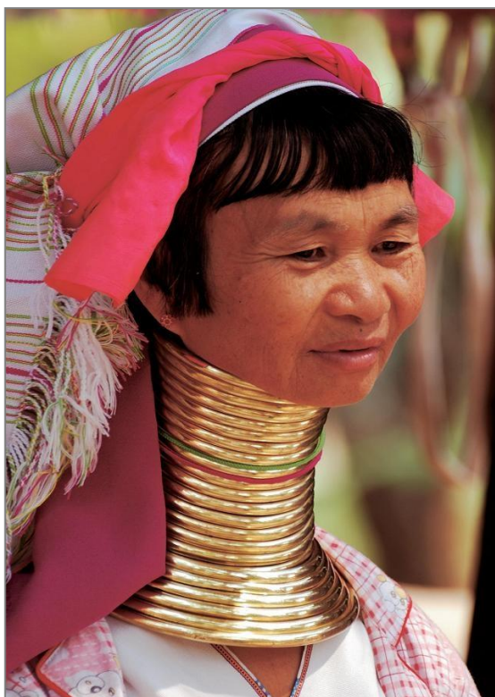
tzv. žirafi krk ženy z kmene Padaung, www.google.cz/images