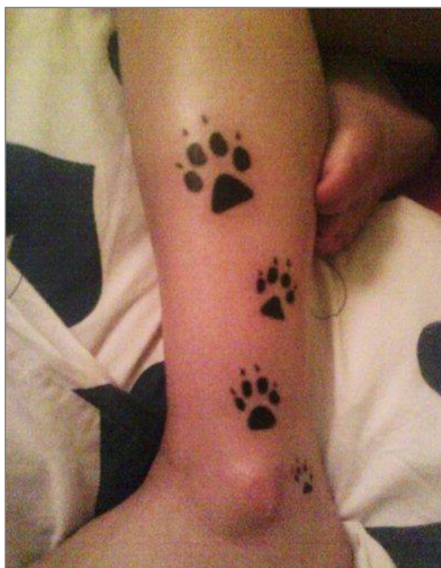
tetování na noze (tattér: Nikola)